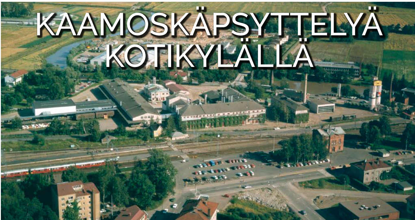
Tikkurilan Värehteaat, Oy Schildt & Hallberg Ab, maali- ja lakkatehdas. Etualalla Tikkurilan asema ja päärata. 1974.