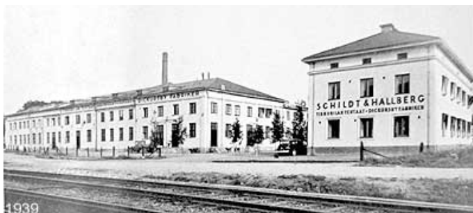
Oy Schildt&Hallberg Ab, 1939

Noinhan se meni, kummallakin kubella samansuuntaiset muistikuvat. Sen verran tarkistin, että värитеhtaan historia juontaa vuoteen 1862, jolloin perustettiin Dickursby Oljeslageri Ab. Sen toimintaa jatkoi vuodesta 1877 Oy Schildt&Hallberg Ab, joka kasvoi ja kehittyi monin vaihein ollakseen Tikkurila Oy vuodesta 1985 ja edelleen vuodesta 2021 alkaen nimellä PPG Finland Oy, amerikkalaisten eläkeläisten omistamana tämä viimeinen.