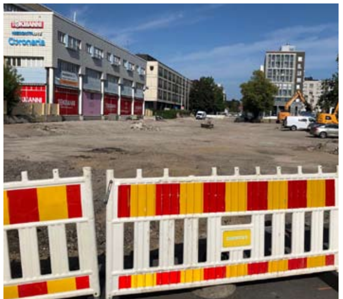
Kielotien ja Asematien risteysalueen ennallistaminen?

Sen verran kuitenkin sanon vielä; sä oot täällä keskustassa liikkueksa nähnyt näitä uusia mylläysiäkin, mutta mulle oli kyllä melkoinen yllätys, kun tulin syyskuun puolella käymään terveysasemalle ja kävelin Prisman parkkikselta Unikkotietä; Kielotien ja Asematien risteys oli kerätty pois! Ei kai ollut kysymys ennallistamishankkeesta, joita mm. Itä-Suomen soilla tehdään. Kieltämättä paikalla oli aiemmin viljavaa savipeltoa... (raitiotien rakentaminen)