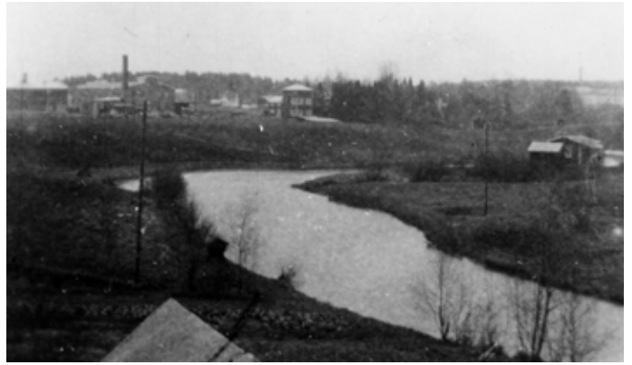
Näkymä Söderlingin Myllylle, 1935-1938

Mylly ei käyttänyt suoranaisesti koskivoimaa, sijaitessaan suvon rannalla, mutta sittemmin kyllä kosken vatkamaa sähköenergiaa, Vernissan laitteistoista. Ensimmäisenä voiman lähteenä oli polttomoottori itse myllyrakennuksessa, mutta sitten sähkö. Sijainti korkeassa, jyrkässä jokitorlässä oli hyvä, koska näin voitiin jyvät ajaa suoraa tieltä ”kahvilatasolle” ja valuttaa sieltä jauhettuna alempana olevaan toiseen kuljetusvälineeseen.