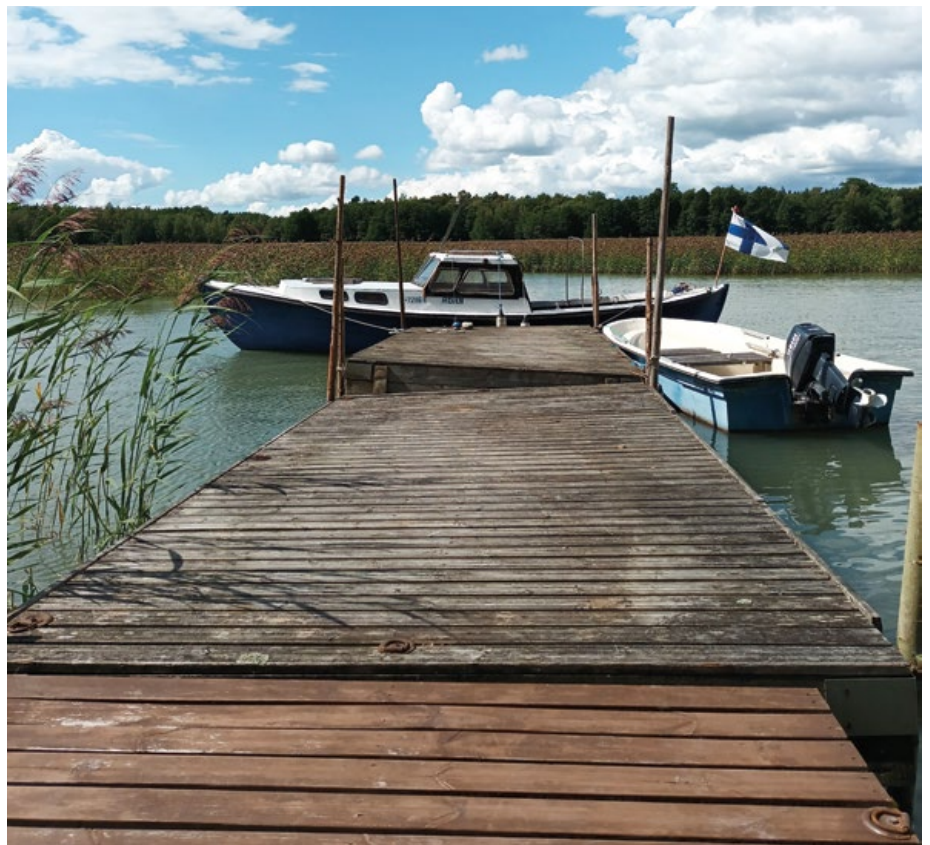
Ponttoonien ja veneiden uusi tuleminen.

Monessa kohtaa on porattu kyyneleitä, ruuveja kiristetty ja ötökkäverhoja kiinnitetty. On samalla tulut havaintoja miespuolisesta Helinä-keijusta. Hänestä, joka ehtii ja tehoaa kuin porettabletti. Jätän avoimeksi, kenestä on kyse, sillä heitä on voinut olla useampia. Vinkki: he tekevät, kun muut vasta aikovat. Koe-tapa tässä sitten rahjustella perässä, kun ”valmista tuli” raikuu jo etunenässä. Tervetuloa myös ihan olemaan ja viihtymään uiden, saunoen ja grillailten. Muistaen aina, että Toivonniemi on potilasyhdistyksen leppopaiikka.