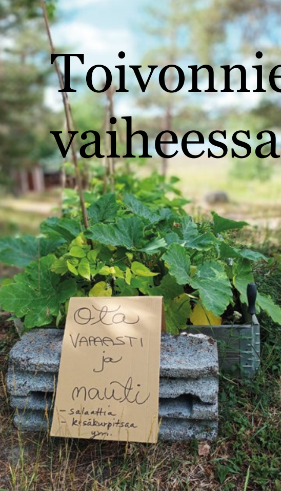
Viherpeukaloinen Toivonniemessä. Kesäkodille istutettiin viljelylaatikoihin syötäviä kasveja kaikkien kävijöiden nautittaviksi.

Ytimekkäästi se on totta: kesäkodissa moneltakin kantilta katsottuna kaikki on vaiheessa eli tekeillä.