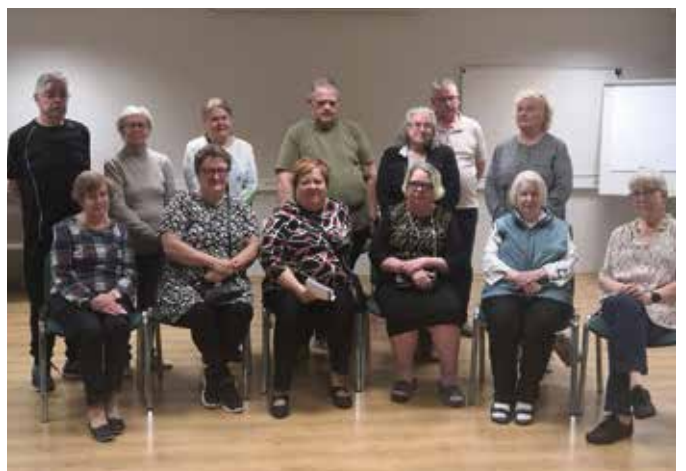
Tässä Kangasalan seudun ja Tampereen hengitysyhdistysten porukkaa viettämässä syyslomaviikkoa Pärnussa hotelli Viking Spa:ssa.