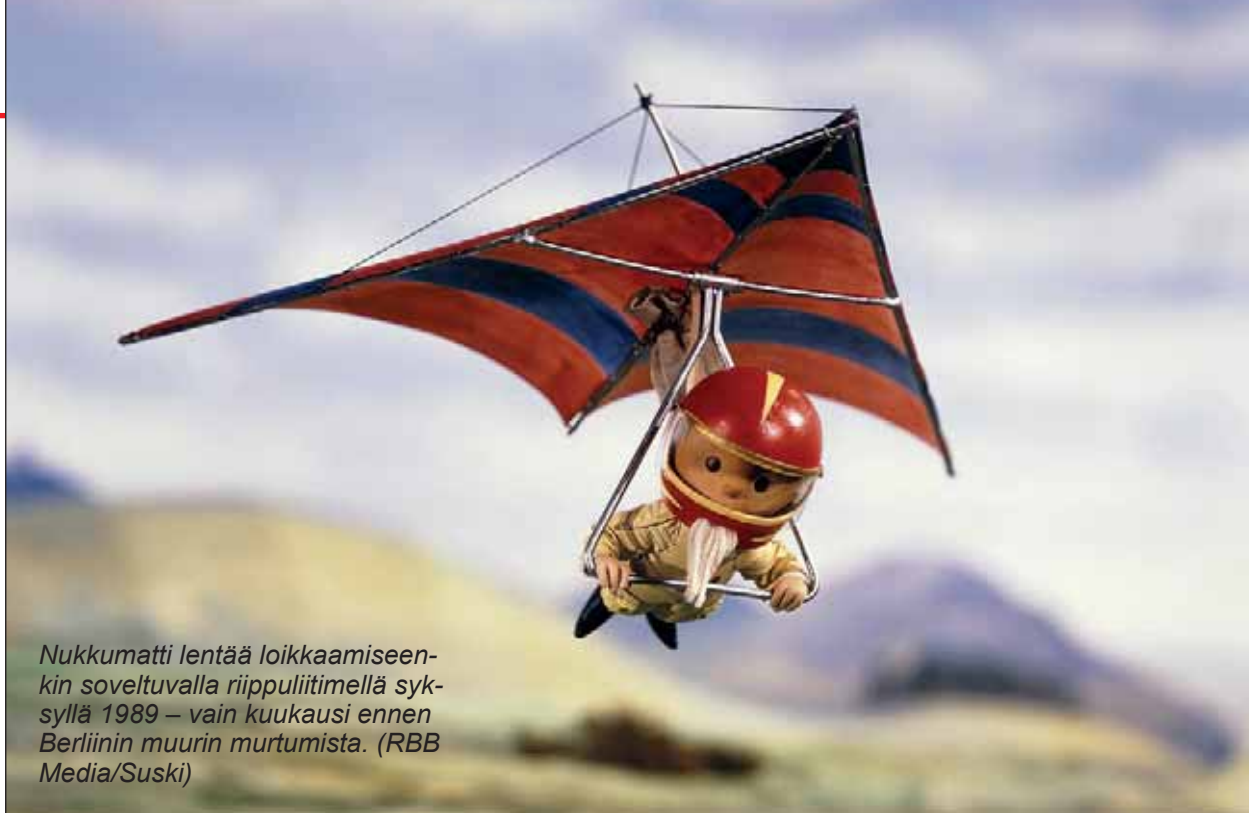
Nukkumatti lentää loikkaamiseen soveltuvalla riippuliitimellä syksyllä 1989 – vain kuukausi ennen Berliinin muurin murtumista.