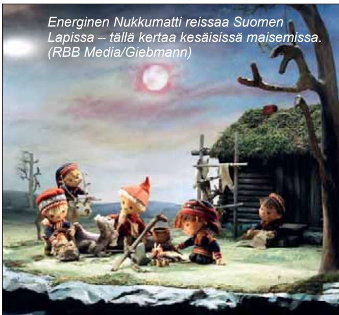
Energinen Nukkumatti reissaa Suomen Lapissa – tällä kertaa kesäisissä maisemissa.