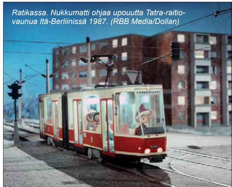
Ratikassa. Nukkumatti ohjaa upouutta Tatra-raitiivaunua Itä-Berliinissä 1987.

DDR:n television tuottama sarja on ammatinsa suvreenisti osaavien ammattilaisten, tuottajien ja animaattorien, kädenjälkeä, huipputyötä. Nukkumattijaksojen tekijät pyrkivät täydellisyyteen pieniä yksityiskohtia myöten.