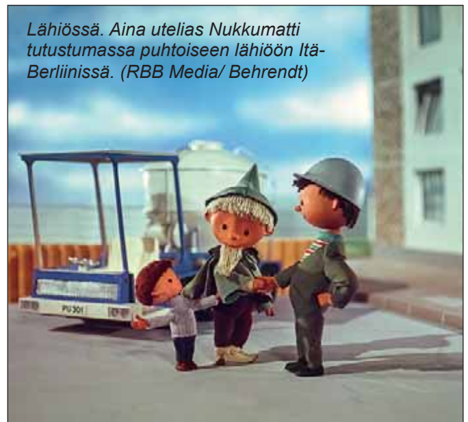
Lähiössä. Aina utelias Nukkumatti tutustumassa puhtoiseen lähiöön Itä-Berliinissä.

Hän teki tutkimusta ja keräsi aineistoa Nukkumatista. Hän pääsi tapaamaan animaatiosarjan tekijöitä, entisiä ja nykyisiä. Näinä aikoina hänen Nukkumattikirjansa hahmottui ja valmistuikin sittemmin monien