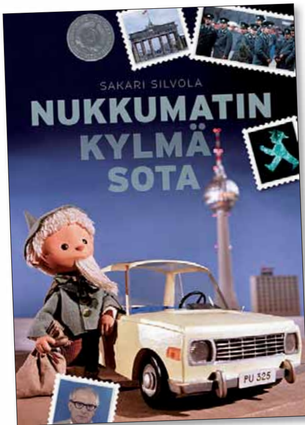
Nukkumatin kylmä sota on aikamatka Itä-Saksaan, kylmän sodan polttopisteeseen. Kirjassa poiketaan Pikku Kakkosenkin kulisseihiin.